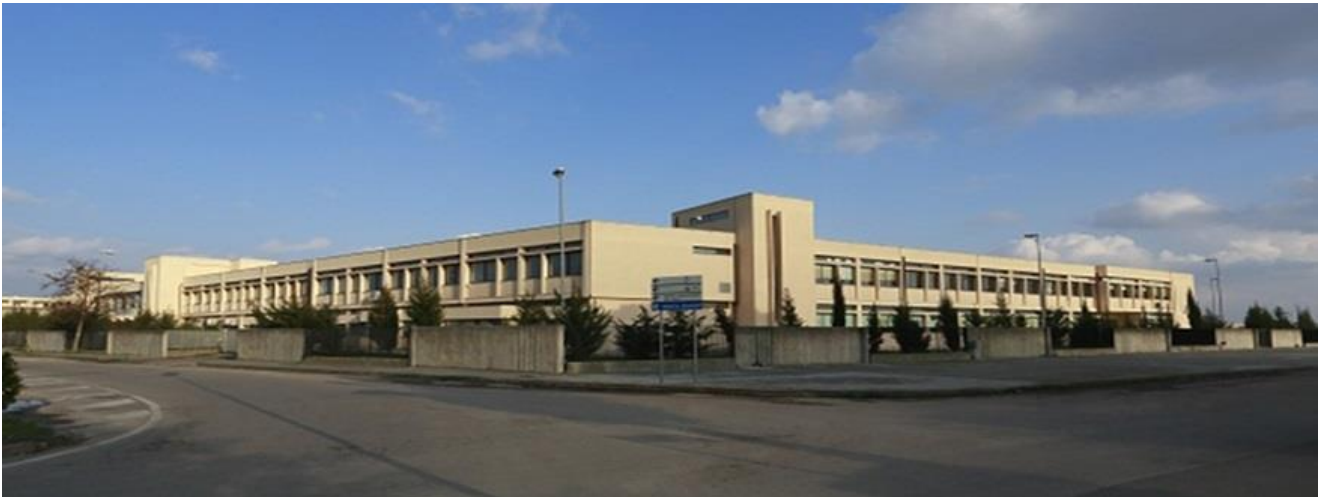
Istituto "N. Moccia" – Sede Centrale di Via Bonfante

Presente nella realtà socio-economica e culturale da sessant'anni, Istituto "N. Moccia" si articola attualmente in tre diversi Indirizzi di studi : "Servizi socio-sanitari" (SSS), "Servizi per l'enogastronomia e l'ospitalità alberghiera" (SEOA), "Manutenzione e assistenza tecnica". (MAT)