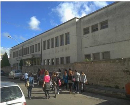
Sede Succursale di Via Bologna

Presente nella realtà socio-economica e culturale da sessant'anni, Istituto "N. Moccia" si articola attualmente in tre diversi Indirizzi di studi : "Servizi socio-sanitari" (SSS), "Servizi per l'enogastronomia e l'ospitalità alberghiera" (SEOA), "Manutenzione e assistenza tecnica". (MAT)